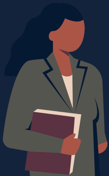
Agente de Cierre

Un tasador es un profesional que estima el valor de una propiedad basándose en la venta de casa comparables en el área y la característicasí de la propiedad. La práctica común es que el prestamista contrata a un tasador y el comprador es responsable del costo