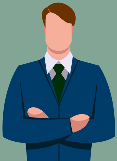
Asesor de Impuestos

Un agente de seguros es una persona empleada para vender pólizas de seguro. Los prestamistas exigen que los propietarios obtengan un seguro de vivienda antes de que se pueda aprobar un préstamo.