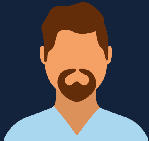
Inspector de Vivienda

Al analizar esta información ellos determinan el riesgo que implica el préstamo y puede aprobar o negar el préstamo. Usualmente se incluye una tarifa de aseguradora de préstamo en los gastos de cierre de el comprador.