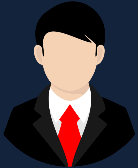
Agente de Seguro

Un agente de seguros es una persona empleada para vender pólizas de seguro. Los prestamistas exigen que los propietarios obtengan un seguro de vivienda antes de que se pueda aprobar un préstamo.