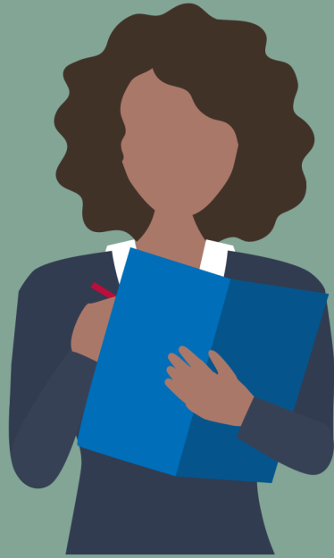
Aseguradora de Hipoteca

La aseguradora de hipoteca es una representante del banco que analiza una solicitud de préstamo, incluyendo el historial de crédito, y tasación de la casa.