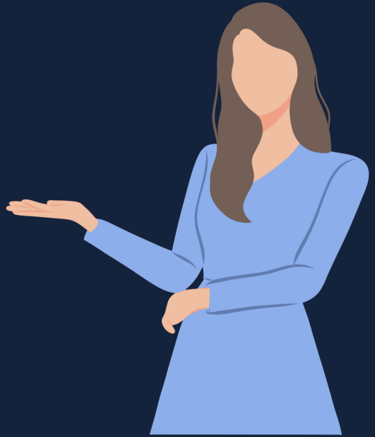
Agente de Bienes Raíces

Un agente de bienes raíces es alguien que tiene licencia para negociar y organizar ventas de bienes raíces a cambio de una comisión. Los compradores y vendedores normalmente tendrán sus propios agentes en la transacción. El vendedor normalmente paga una comisión a ambos agentes