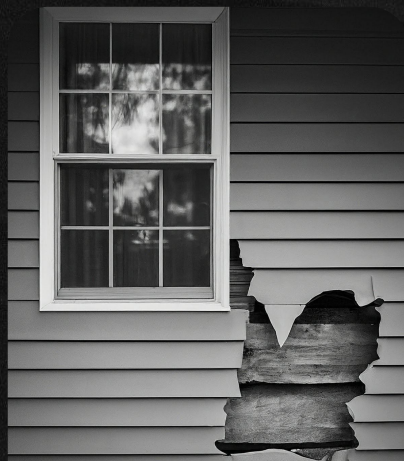
ESTALLO DE TUBERIA