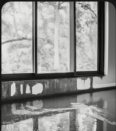
DESBORDAMIENTO DE AGUA